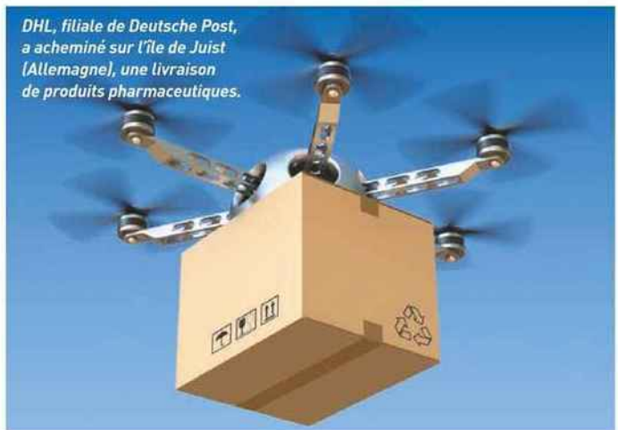
DHL, filiale de Deutsche Post, a acheminé sur l'île de Juist (Allemagne), une livraison de produits pharmaceutiques.