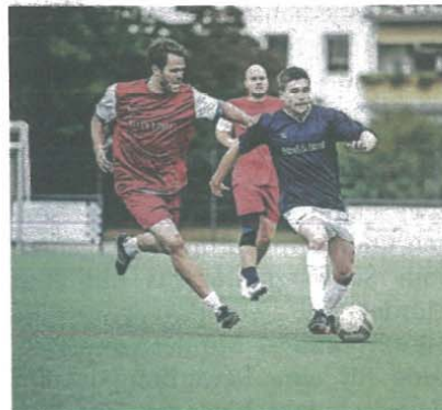
Die Kanzleien Bird & Bird und Allen & Overy im Duell