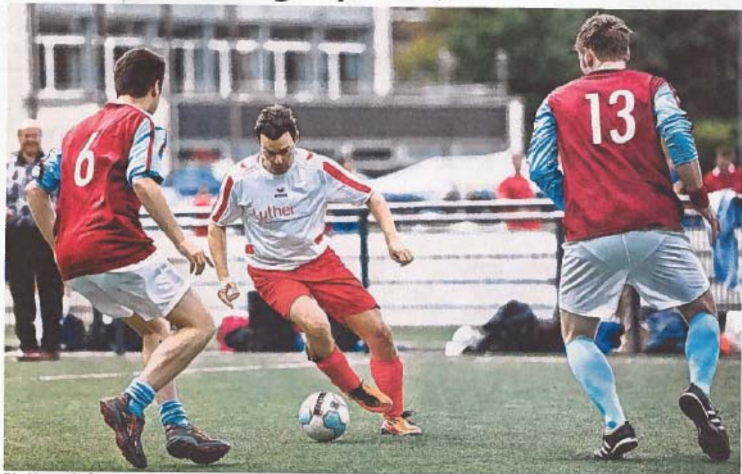
Die Mannschaft von Price Waterhouse Coopers gegen Luther (in weißen Trikots).