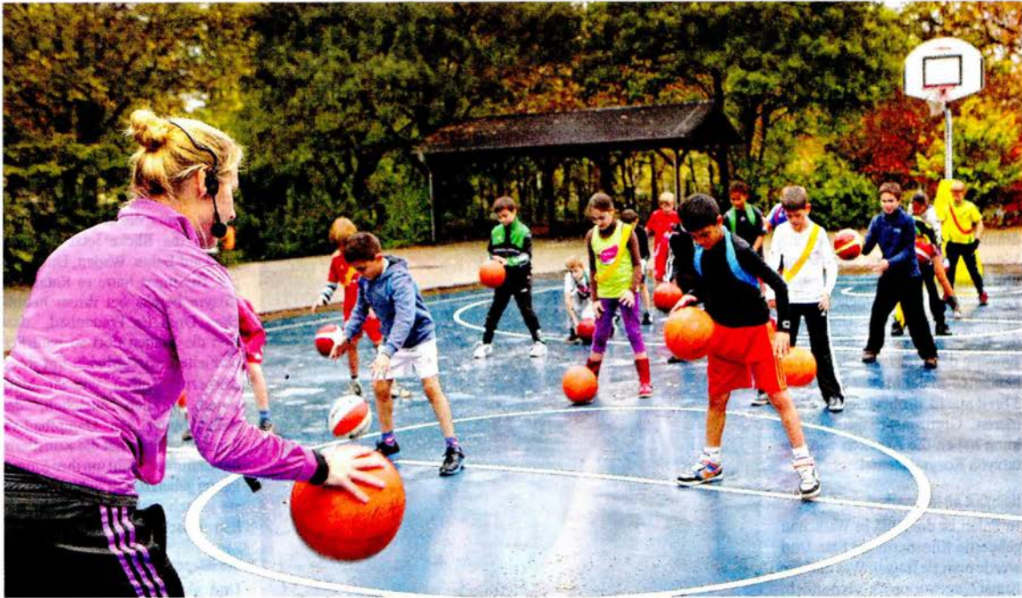
Da störte auch der Regen nicht. Die Schülerinnen und Schüler zeigen auf dem Multifunktionssportplatz ihr Können: Hier beim Basketball.