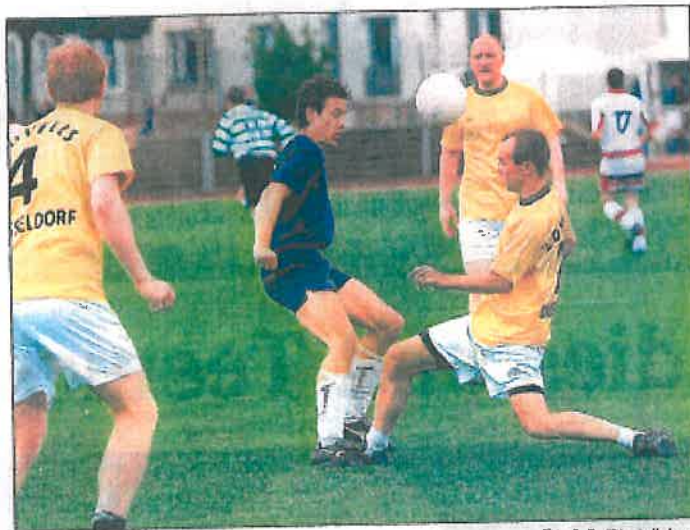
Zwei Düsseldorfer Sozietäten im sportlichen Wettkampf: Bird & Bird (blau) und Lovells (gelb-weiß). Am Ende siegten die Kölner.