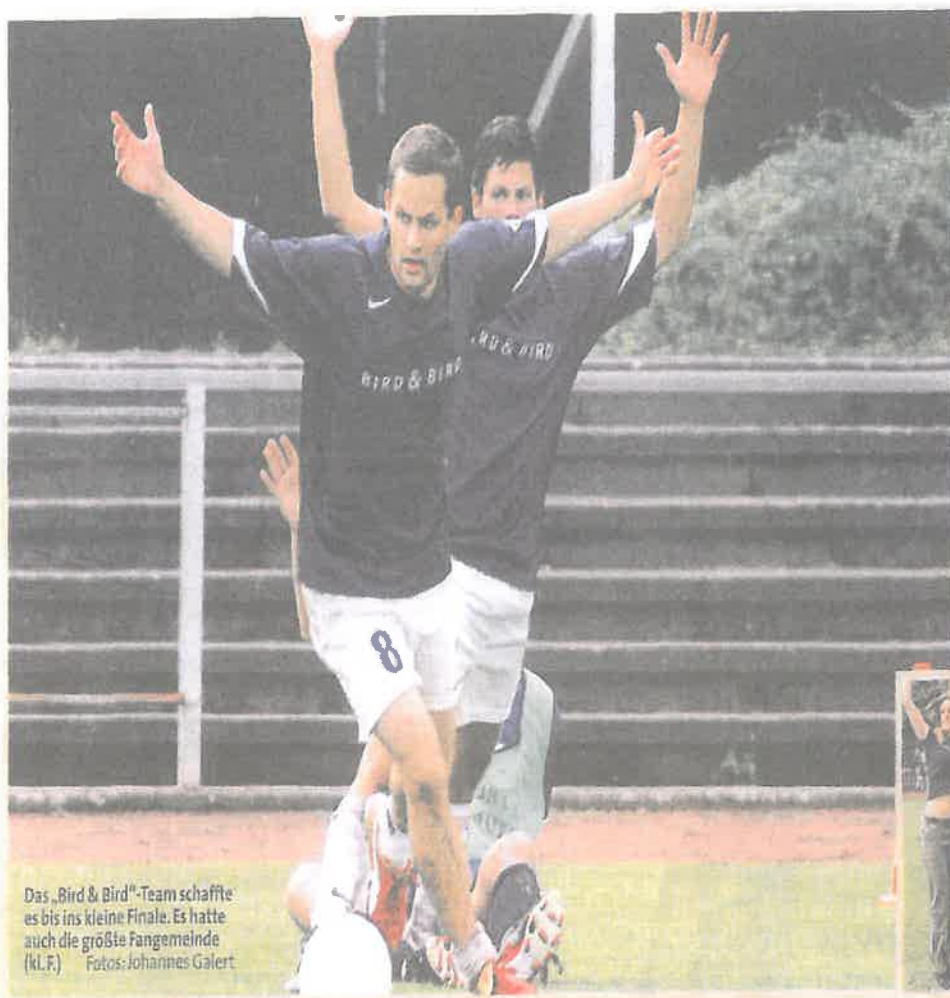
Das „Bird & Bird“-Team schaffte es bis ins kleine Finale. Es hatte auch die größte Fangemeinde (K.L.F.)