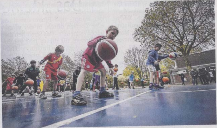
Besonders die Fünftklässler freuten sich über das blaue Feld, das den Standards eines Basketballfeldes nach den Vorgaben aus 2012 entspricht.

„Sport ist eine wichtige Möglichkeit, etwas zusammen zu machen, es verbindet und hilft, die Gesellschaft besser zu machen“, erklärte Schröder-Frerkes. Besonders die