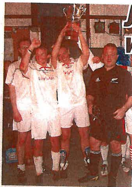
Siegerehrung: Die „Linklaters“ freuen sich über den 3. Pokal in Folge.