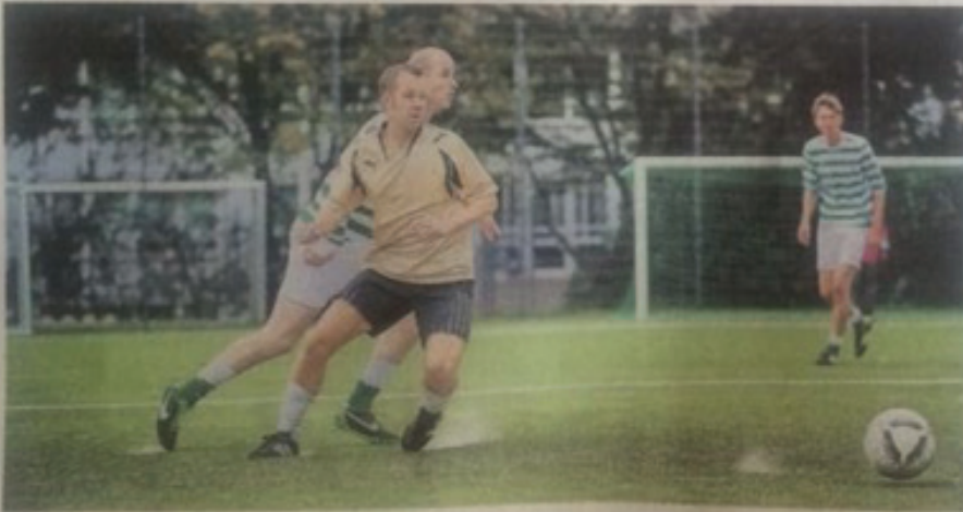
Zum Beispiel spielte die Kanzlei Taylor Wesseling (in gestreiften Trikots) gegen die Anwälte von Clifford Chance.