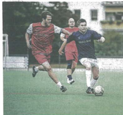
Die Kanzleien Bird & Bird und Allen & Overy im Duell