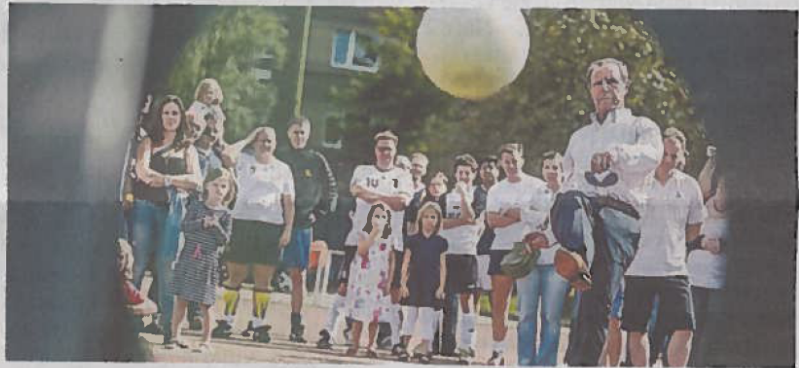
Berti Vogts verlor beim Torwandschießen gegen die Besucher. Sie kickten beim Twobirds.cup für einen guten Zweck.