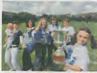
Um diesen Pott ging es beim Two-birds-Cup.