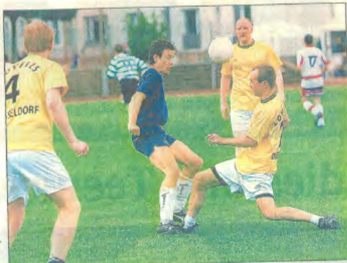
Zwei Düsseldorfer Sozietäten im sportlichen Wettkampf: Bird & Bird (blau) und Lovells (gelb-weiß). Am Ende siegten die Kölner.

war ihm irgendwann klar: Wir brauchen eine Rock- und Pop-Akademie. Gesagt, getan: Am 13. September starten Wölli und andere Profis aus dem Biz mit Wochenend-Workshops (Bandcoaching, DJ- und Drum-Workshop etc). Ziel: Zu zeigen, wie man's richtig macht. Weitere Infos? Mailen an: stirken@rockam-turm.de