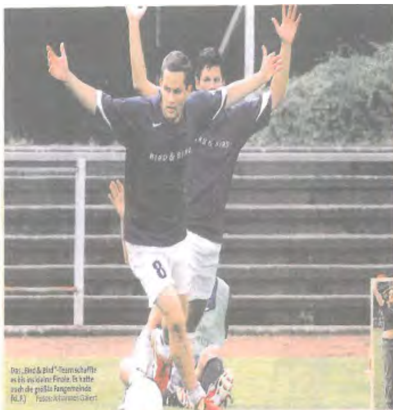
Das „Bird & Bird“-Teamschiffe wird zu einer Final-16 hatte auch die größte Fangemeinde (d.F.)