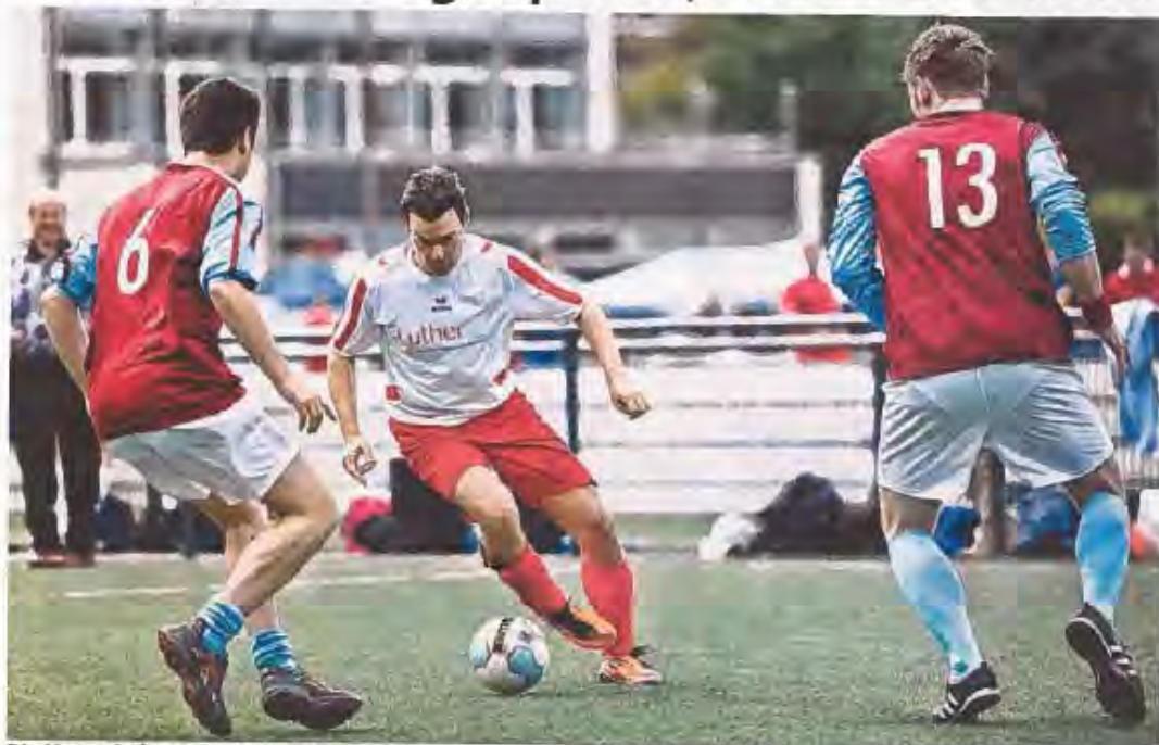
Die Mannschaft von Price Waterhouse Coopers gegen Luther (in weißen Trikots).