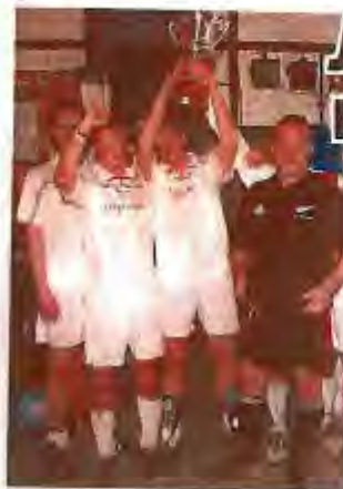
Siegerehrung: Die „Linklaters“ freuen sich über den 3. Pokal in Folge.