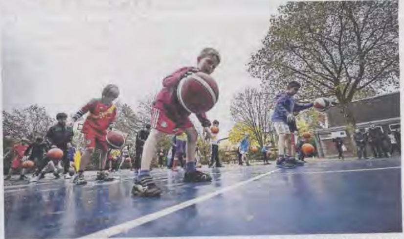
Besonders die Fünftklässler freuten sich über das blaue Feld, das den Standards eines Basketballfeldes nach den Vorgaben aus 2012 entspricht.

„Sport ist eine wichtige Möglichkeit, etwas zusammen zu machen, es verbindet und hilft, die Gesellschaft besser zu machen“, erklärte Schröder-Frerkes. Besonders die