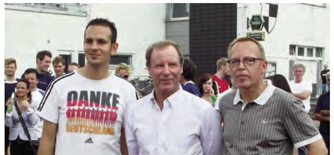
Berti Vogts hat bei der Charity mit seinen Fußballkünsten tatkräftig unterstützt.