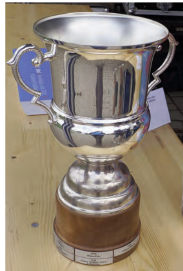
Der begehrte Cup! Wer wird ihn dieses Jahr mit nach Hause nehmen?