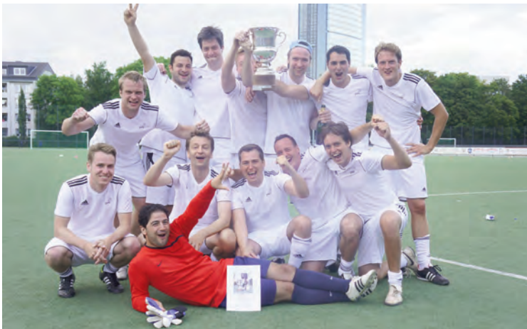
PwC Legal freut sich 2012 über den ersten Turniersieg. Sie besiegten Oppenhoff & Partner im Finale mit 1:0!