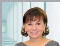
华珮 北莱茵威斯特法伦州投资促进署署长