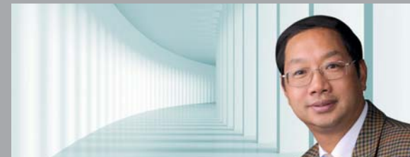
汉娜洛勒·克拉夫特 德国北莱茵威斯特法伦州州长