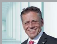
汉斯·于尔根·彼特劳施克 诺伊斯莱茵县县长